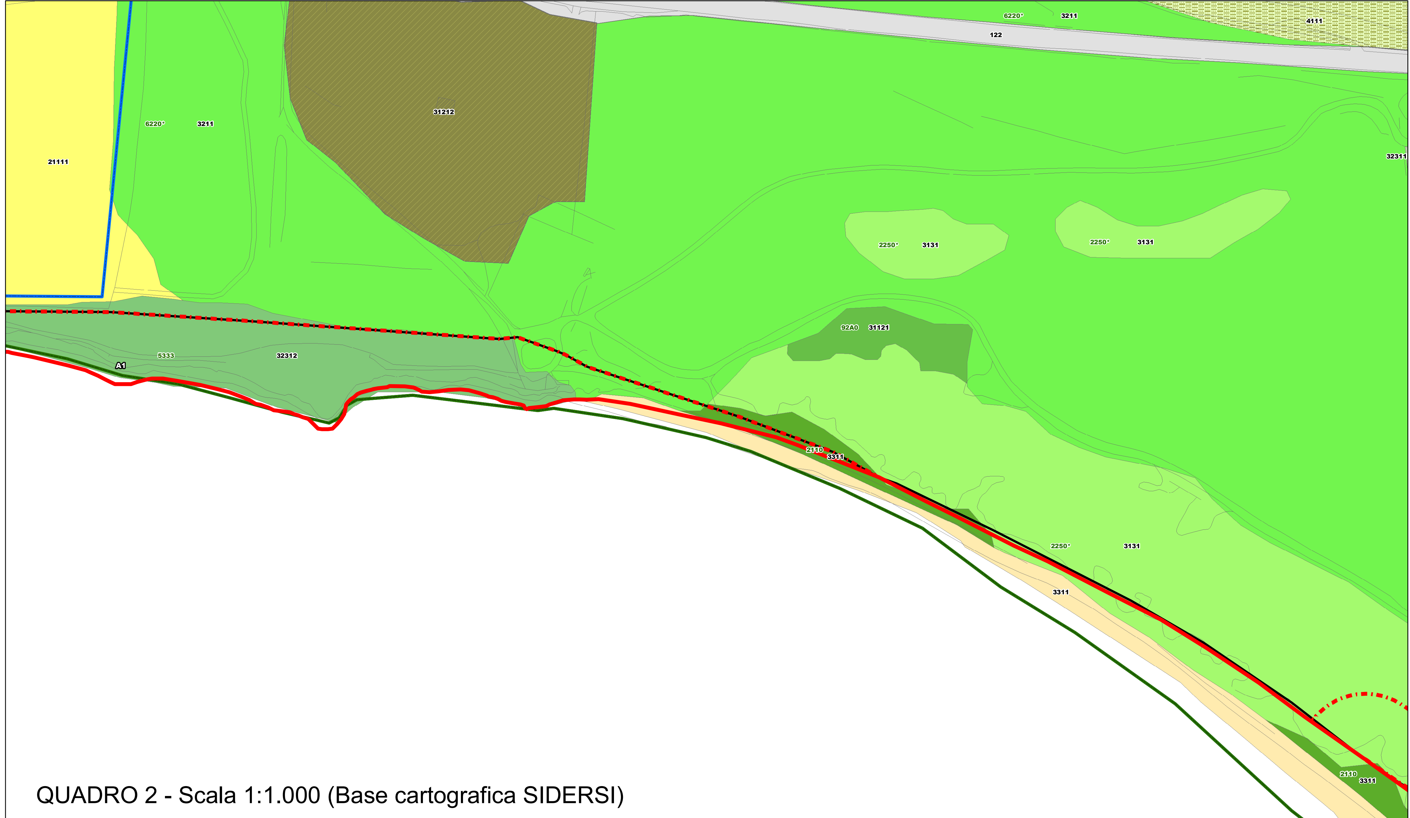
QUADRO 2 - Scala 1:1.000 (Base cartografica SIDERSI)