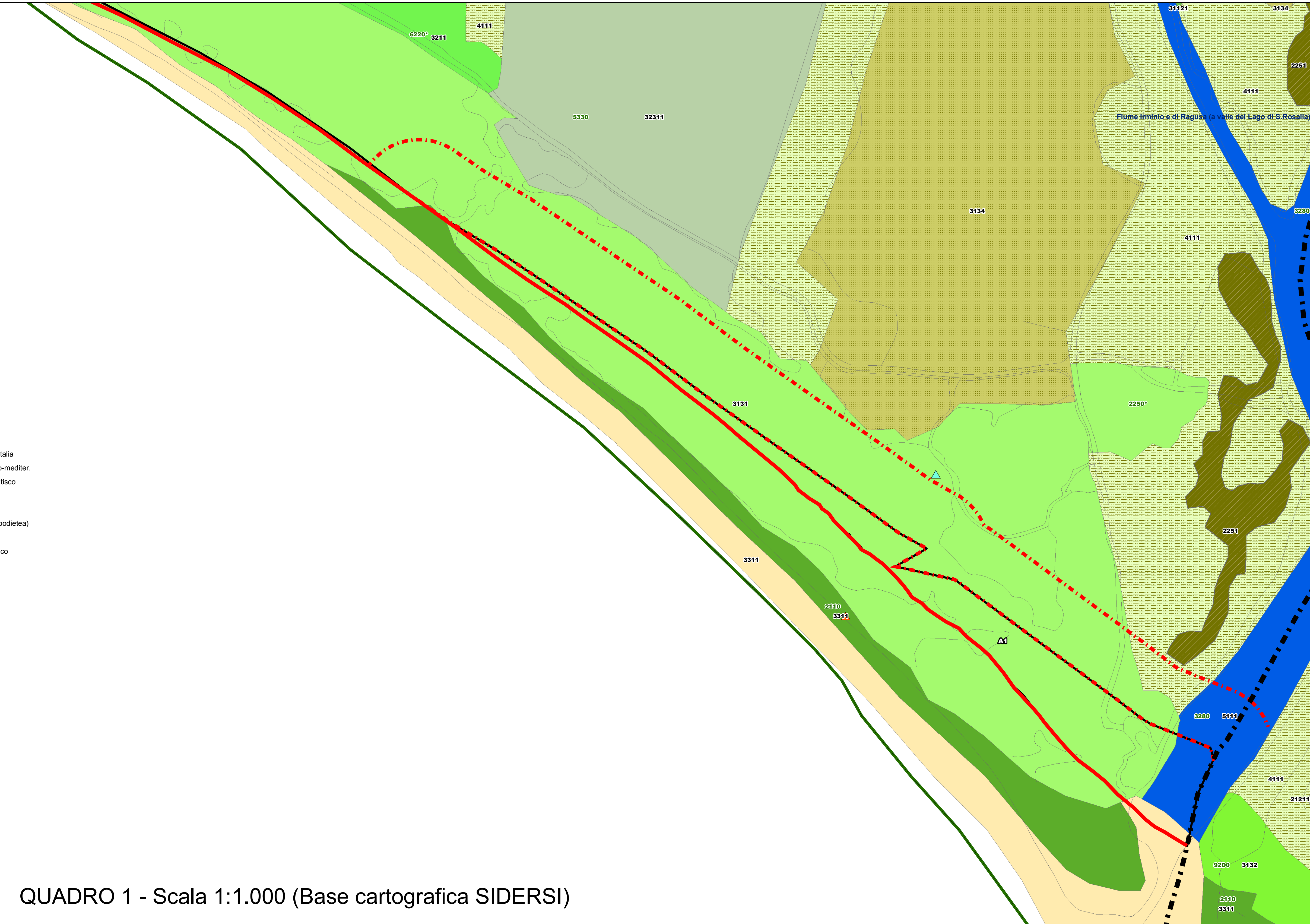
QUADRO 1 - Scala 1:1.000 (Base cartografica SIDERSI)